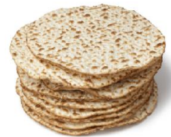
brood van bevrijding